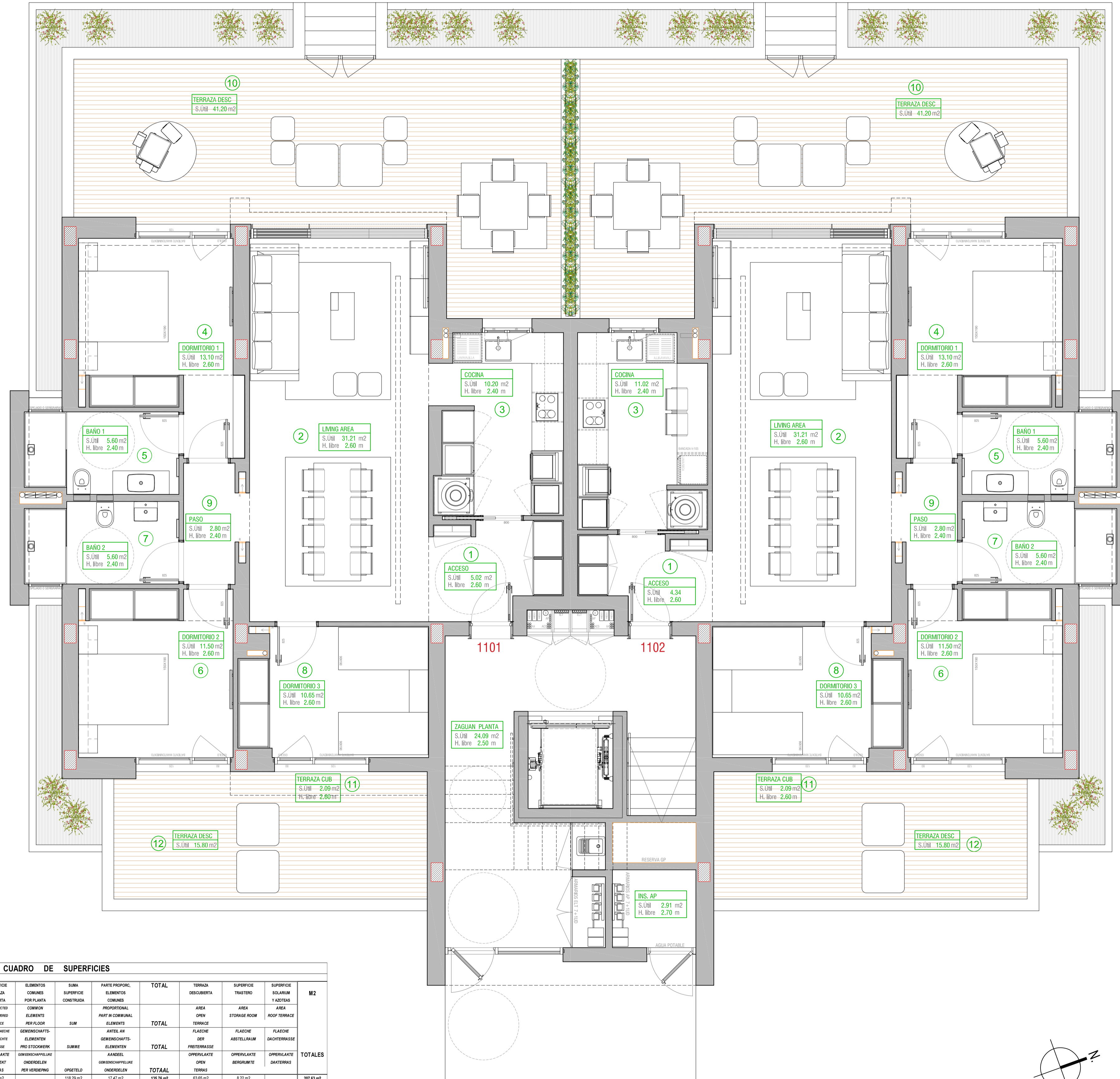
CUADRO DE SUPERFICIES