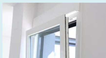
Внутренний оконный профиль из ПВХ белого цвета