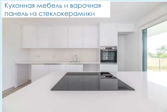
Кухонная мебель и варочная панель из стеклокерамики