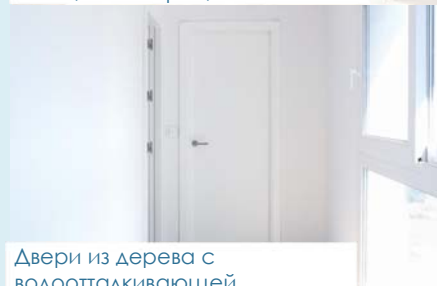
Двери из дерева с водоотталкивающей