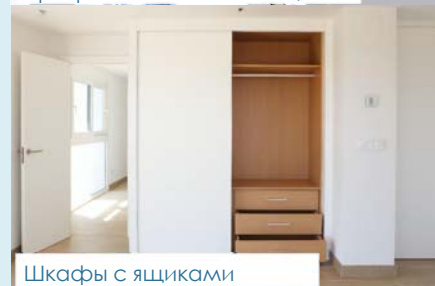
Шкафы с ящиками