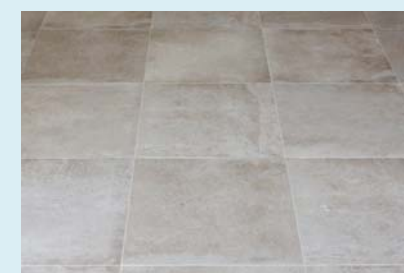
Напольное покрытие Newport Beige