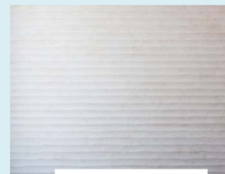
Плитка Old Beige