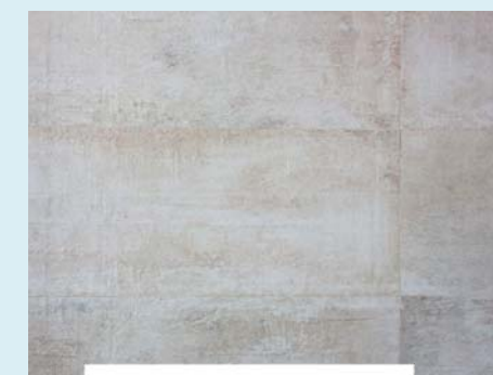
Плитка Newport Beige