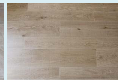
Напольное покрытие Oxford