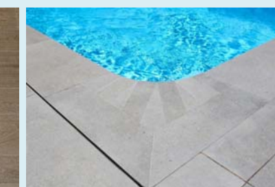
Напольное покрытие Deep Light Grey