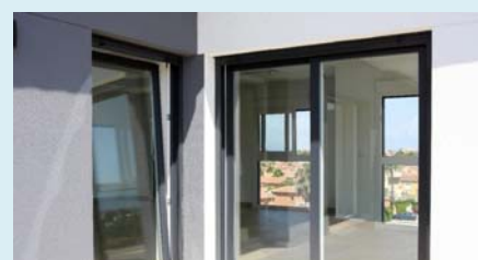
Наружный оконный профиль из ПВХ цвета антрацит