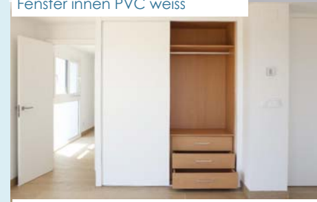
Schränke mit Auskleidung und Schubladen