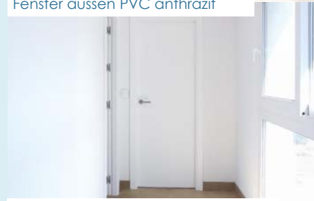
Türen aus wasserabweisendem Holz