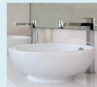
Armaturen als Einhebelmischer