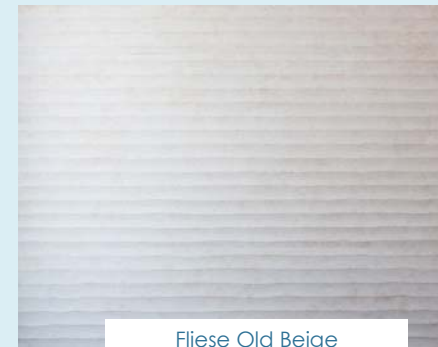
Fliese Old Beige