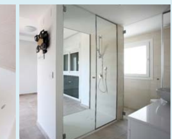
Duschwand und Duschbecken