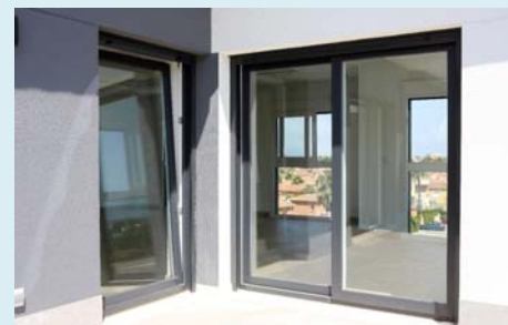
Fenster aussen PVC anthrazit