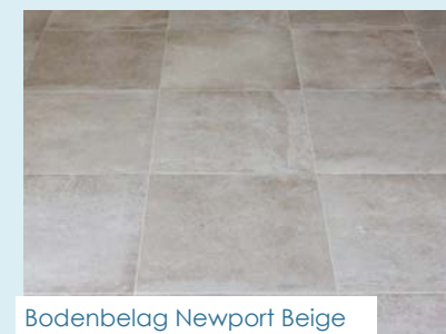
Bodenbelag Newport Beige