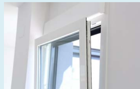
Fenster innen PVC weiss