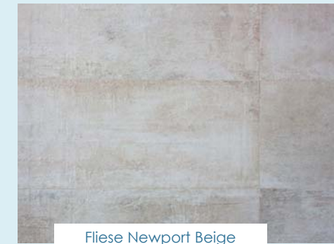
Fliese Newport Beige