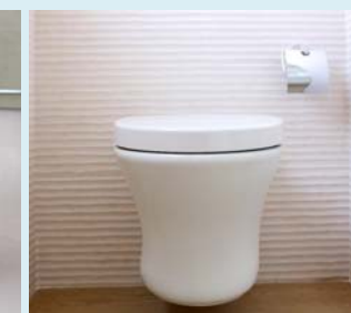
Toilette zur Wandinstallation