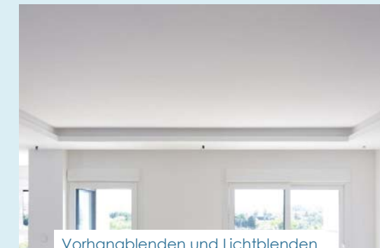
Vorhangblenden und Lichtblenden