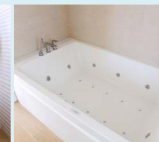
Badewanne mit Wassermassage