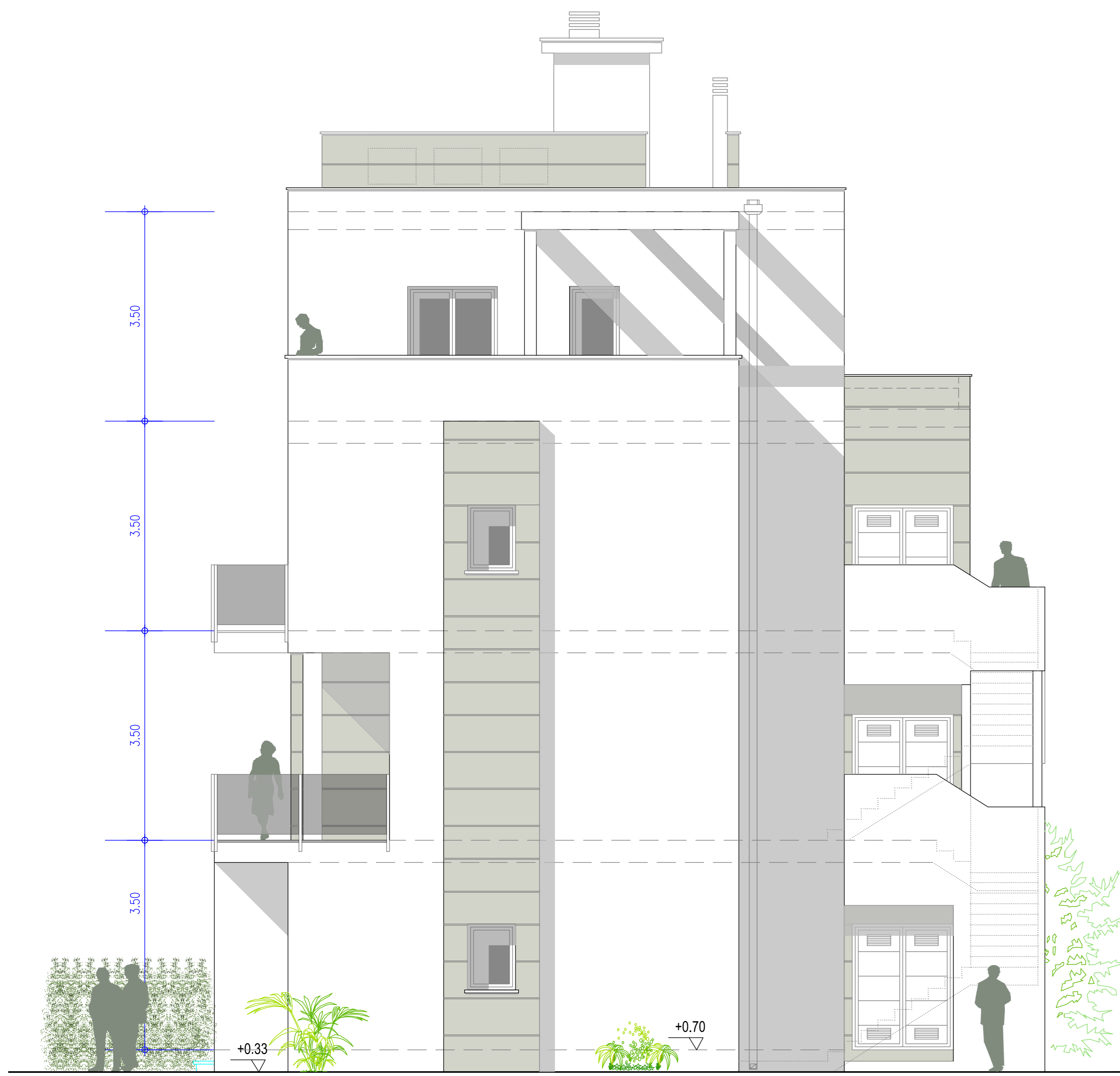
ALZADO LATERAL IZQUIERDO LEFT LATERAL ELEVATION LINKE SEITENANSICHT AANZICHT LINKERZIJDE ÉLÉVATION CÔTÉ GAUCHE

El presente proyecto es propiedad de Construcciones Hispano Germanas S.A., su utilización total o parcial, así como cualquier reproducción o cesión o terceros, requerirá la previa autorización de CHG.