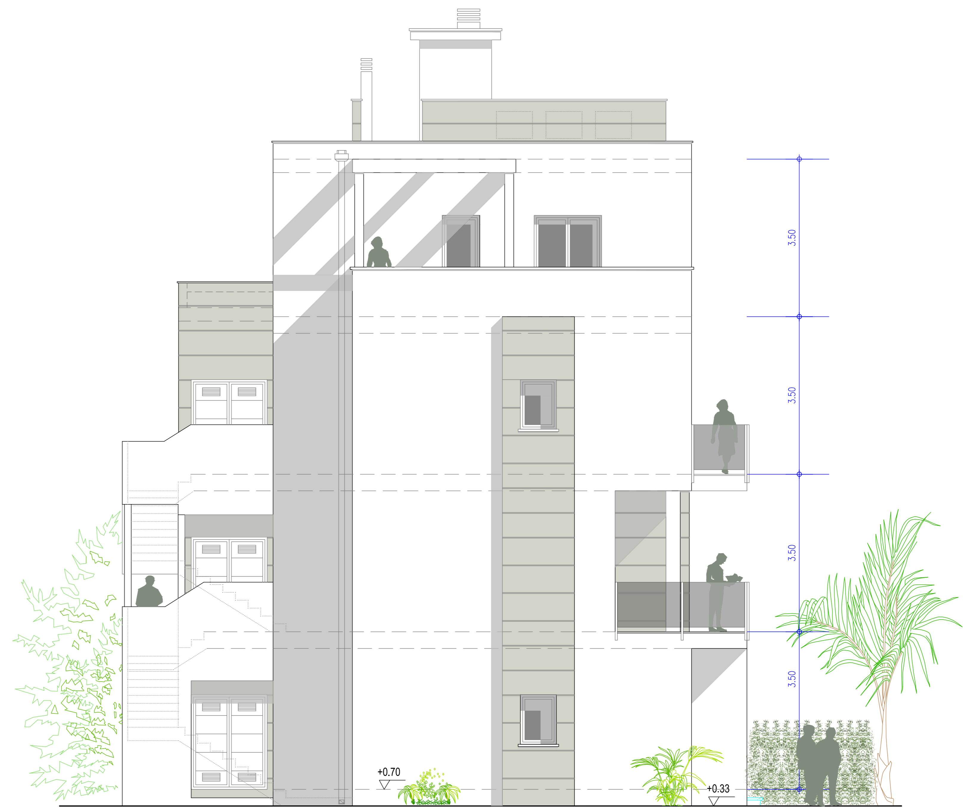
ALZADO LATERAL DERECHO RIGHT LATERAL ELEVATION RECHTE SEITENANSICHT AANZICHT RECHTERZIJDE ÉLÉVATION CÔTÉ DROIT